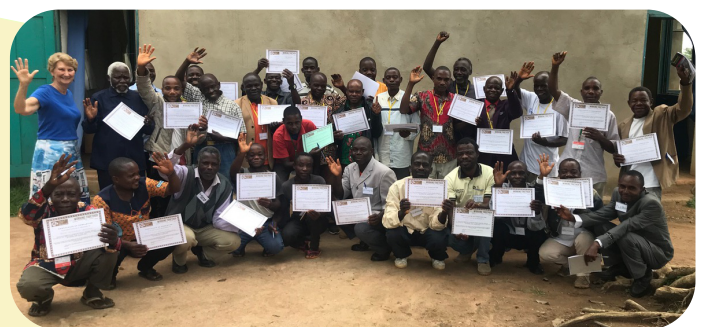
Pygmeë evangelisten aan einde van de training

(De tekst gaat op de achterzijde verder)