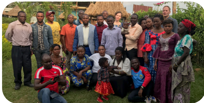
Afscheid van collega's Itendey

We hebben niet alleen afscheid genomen van Congo, maar ook van u als onze achterban van het werk wat we in Congo mochten doen. We willen u in deze laatste nieuwsbrief nogmaals hartelijk danken voor al uw meeleven, gebed en financiële ondersteuning die dit werk mogelijk hebben gemaakt. We hopen dat het voor u geen volledig afscheid van Congo betekent, want de mensen in Congo en onze broeders en zusters van de Communauté Emmanuel hebben het ontzettend zwaar en hebben ons ook gezegd om u te vragen hen niet te vergeten in hun lijden. Via gzb.nl/congo kunt u op de hoogte blijven van het werk dat namens de GZB doorgaat in Congo.