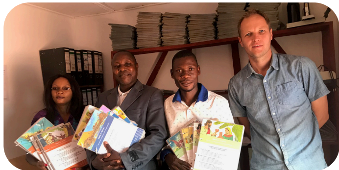
De zondagsschoolboeken zijn af!

Het is bemoedigend om te horen en te zien dat het zondagsschoolwerk goed wordt doorgezet vanuit het kerkelijk bureau in Bunia. Boeken worden door de kerk zelf geprint en geplastificeerd en in elk district worden door getrainde pastors trainingen gegeven, waarna de boeken verspreid worden. Het was bij onze laatste training in februari mooi om te zien hoe enthousiast mensen zijn over deze methode en dit materiaal. We bidden dat dit tot zegen mag zijn voor de duizenden kinderen die de zondagsscholen van de Communauté Emmanuel bezoeken.