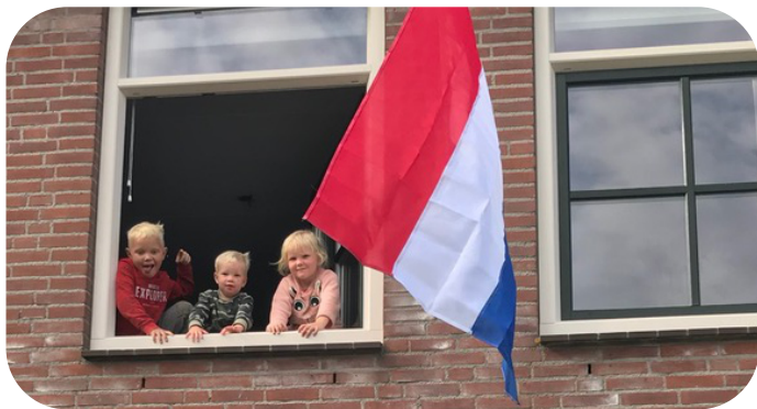
Een Nederlands huis

De kinderen waren gelukkig al snel tevreden met het wonen in Nederland. Voor ons gevoel zijn ze ook opgelucht om nu eindelijk een 'eigen huis' te hebben. Ze zijn op hun school goed begeleid en genieten van het contact met hun klasgenootjes. In de buurt rond ons huis zijn allerlei speeltuintjes waar ze met hun fiets of step naar toe kunnen racen. We zijn dankbaar dat het zo goed met ze gaat.