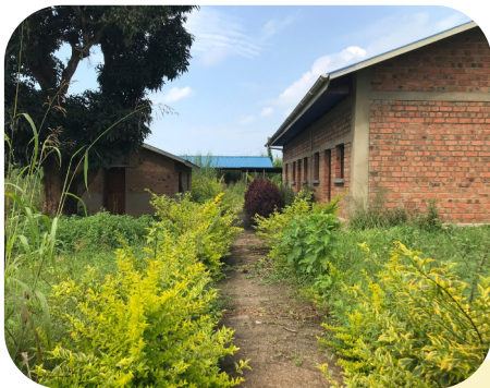
Verwilderd ziekenhuis in Itendey

In het ziekenhuis van Lolwa is het de laatste tijd een drukte van belang. Het ziekenhuis ligt aan de 'grote weg' en er komen veel mensen vanuit de steden Mambassa (50 km) en Komanda (35km). Het ziekenhuis begint steeds meer naamsbekendheid te krijgen door de kwaliteit van zorg en de mogelijkheden van diagnostiek met onder andere echo, X-ray en gastroscopie. Het is mooi om het ziekenhuis zo snel te zien groeien, maar het zorgt ook voor uitdagingen. Te meer omdat we tijdelijk in een tent verblijven vanwege de renovatie van de kinderafdeling. De organisatie is niet op drukte voorbereid en het personeel moet hard werken om alles bij te kunnen benen. Dat zorgt voor frustraties. Door de drukte staat ook de kwaliteit onder druk. Een bloeddruk wordt bijvoorbeeld vaker niet dan wel gemeten. Een patiënt kan soms een hele dag in het ziekenhuis liggen zonder zijn medicatie te krijgen. Anderen hebben wonden die meerdere dagen niet verzorgd worden. Accepteren dat er dingen gebeuren die 'niet horen of niet juist zijn', is voor ons een grote uitdaging. In Congo nemen onze collega's het leven meer zoals het komt, zonder de neiging om alles te willen beheersen en te verbeteren.