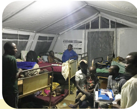
Ziekenhuisafdeling in een tent