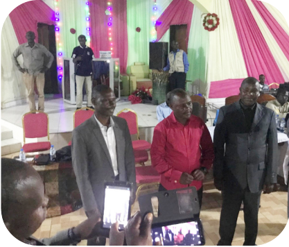
Nieuw bestuur van CE-39

In oktober heeft de generale synode van de Communauté Emmanuel plaatsgevonden. Daarbij is ook het nieuwe bestuur van de kerk gekozen. We zijn dankbaar dat dit, voor zover wij weten, zonder veel (etnische) spanningen is verlopen. De nieuwe voorzitter is een professor van de Shalom Universiteit. Het is een heel actieve en nederige man en we merken dat dit nu al geholpen heeft voor de verschillende projecten die gedaan worden in samenwerking met de GZB. Eén van die projecten is de training voor zondagsschoolleiders. Het is belangrijk dat kinderen goed Bijbels onderwijs krijgen. We hebben het trainingsmateriaal met het bestuur en verschillende predikanten uit Lolwa besproken. Zij reageerden erg positief. Op dit moment worden de lessen lokaal in het Swahili vertaald en we hopen over enkele weken alles te kunnen printen en plastificeren vanuit ons huis. Daarnaast hopen we binnenkort verschillende leiders van de kerk een training over het materiaal te geven en deze training met hen te evalueren. De bedoeling is dat na deze eerste training de leiders zelf de training in de verschillende kerkdistricten houden en daarbij het materiaal verspreiden.