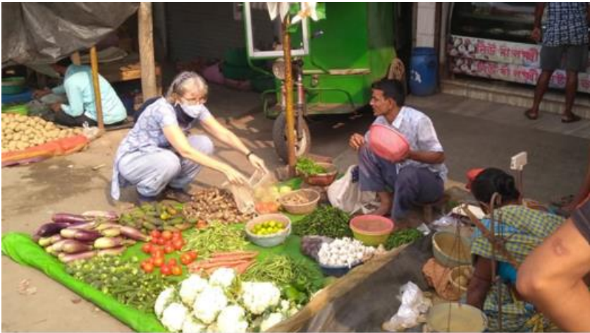
Wij zijn nog altijd heel precies met mondkapjes, maar veel verkopers hier hebben dat opgegeven.

De huisjes met sterren vormen een hele kleine minderheid in deze grote wijk met tienduizenden mensen. We bidden dat juist ook in deze tijd de gelovigen hun licht kunnen laten schijnen in de duisternis.