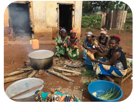
Maaltijd voorbereiding voor feest na doopdienst